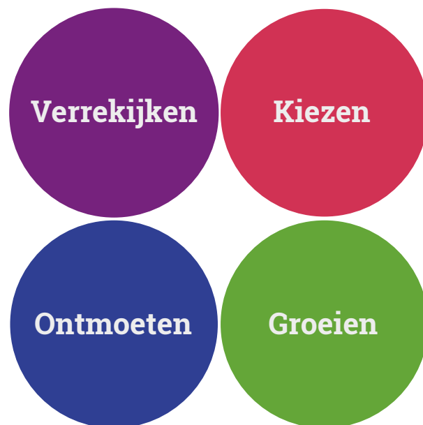
Fig. 1. Ambities voor het onderwijs

De CSG heeft vier ambities geformuleerd, deze zijn beschreven in het schoolplan van de CSG . Deze ambities geven weer wat de CSG wil meegeven aan de leerlingen.